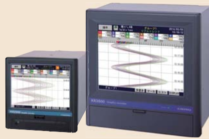
グラフィックレコーダ KR2500/KR3500