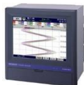
グラフィックレコーダ 記録+成分計用演算対応