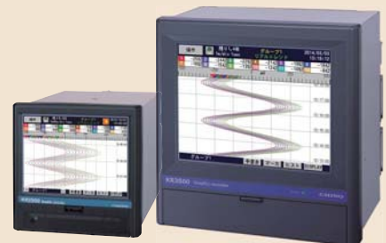
グラフィックレコーダ KR2S00/KR3S00